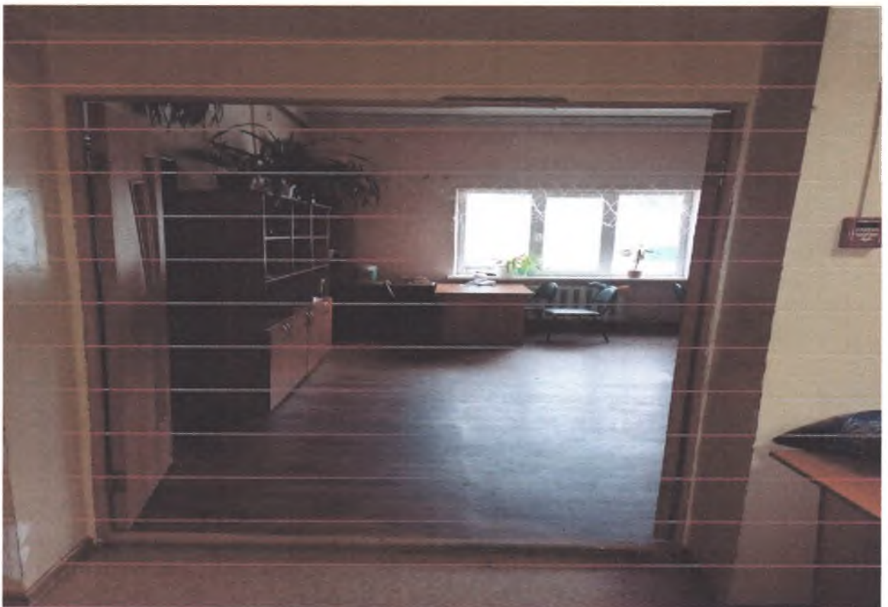
4. Вход в зрительный зал.