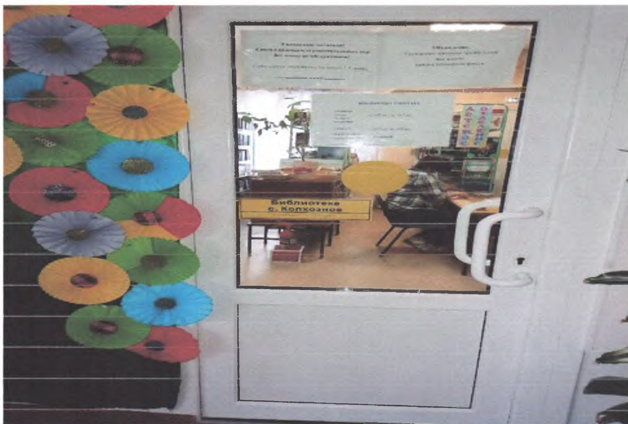
8. Вход в библиотеку.