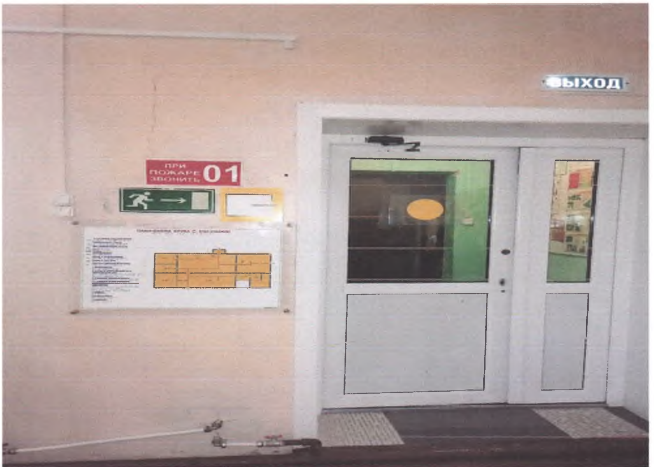
3. Вход в фойе. Тактильная мнемосхема.