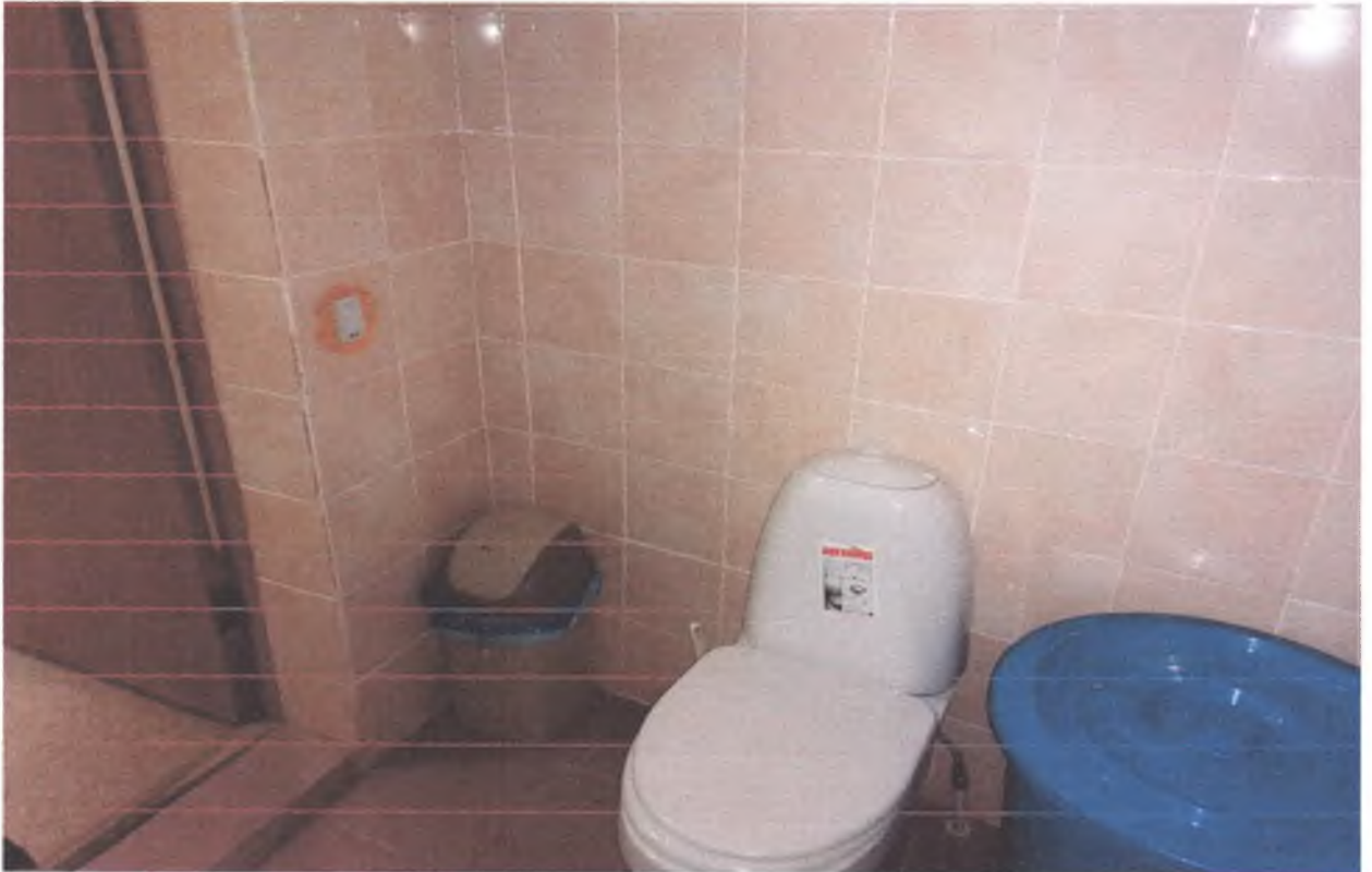
6. Туалет с кнопкой вызова