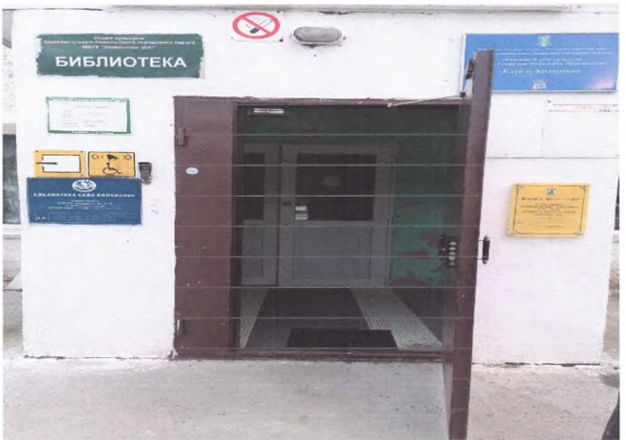
1. 2. Центральный вход