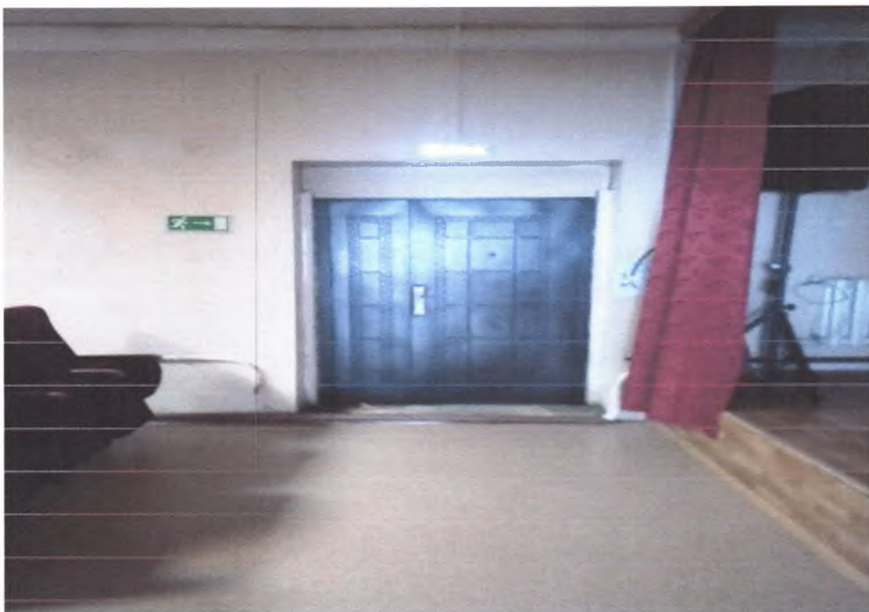
7. Эвакуационный выход из зрительного зала.