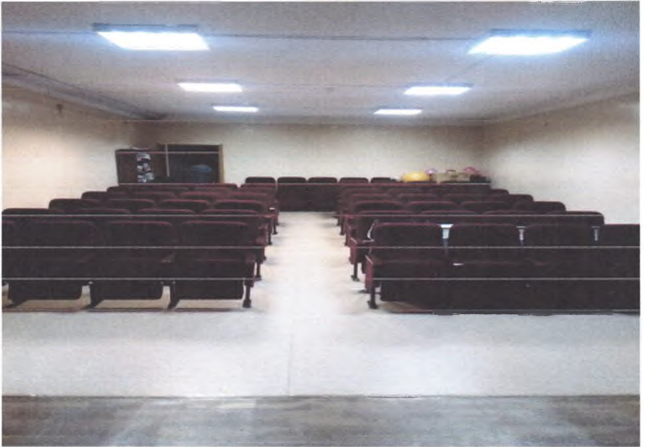
5. Зрительный зал.