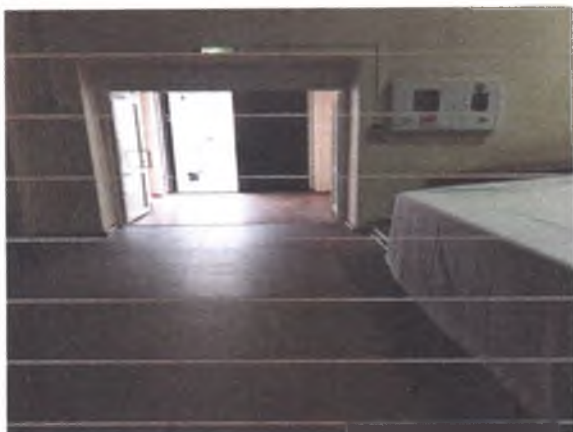
13. Выход из зрительного зала